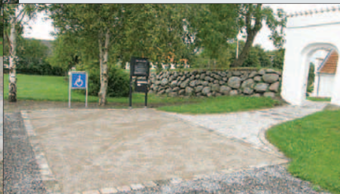
Billeder fra renoveringen af kirkegården samt de omkringliggende områder.