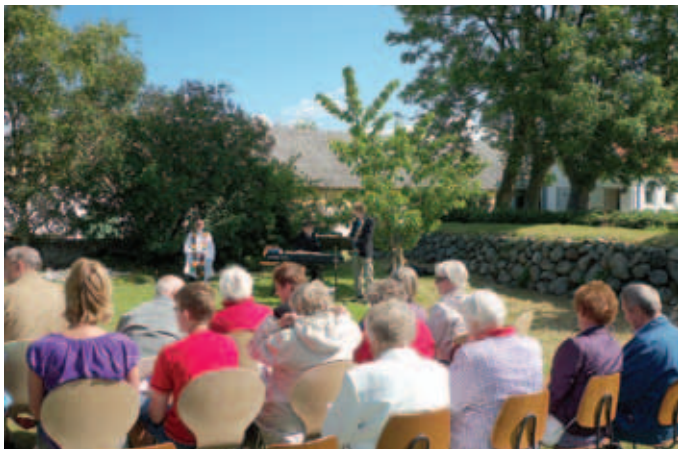
Foto fra friluftstjenesten, der blev afholdt i pinsen ude foran Nørholm kirke.